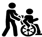
Personnes handicapées ou dépendantes